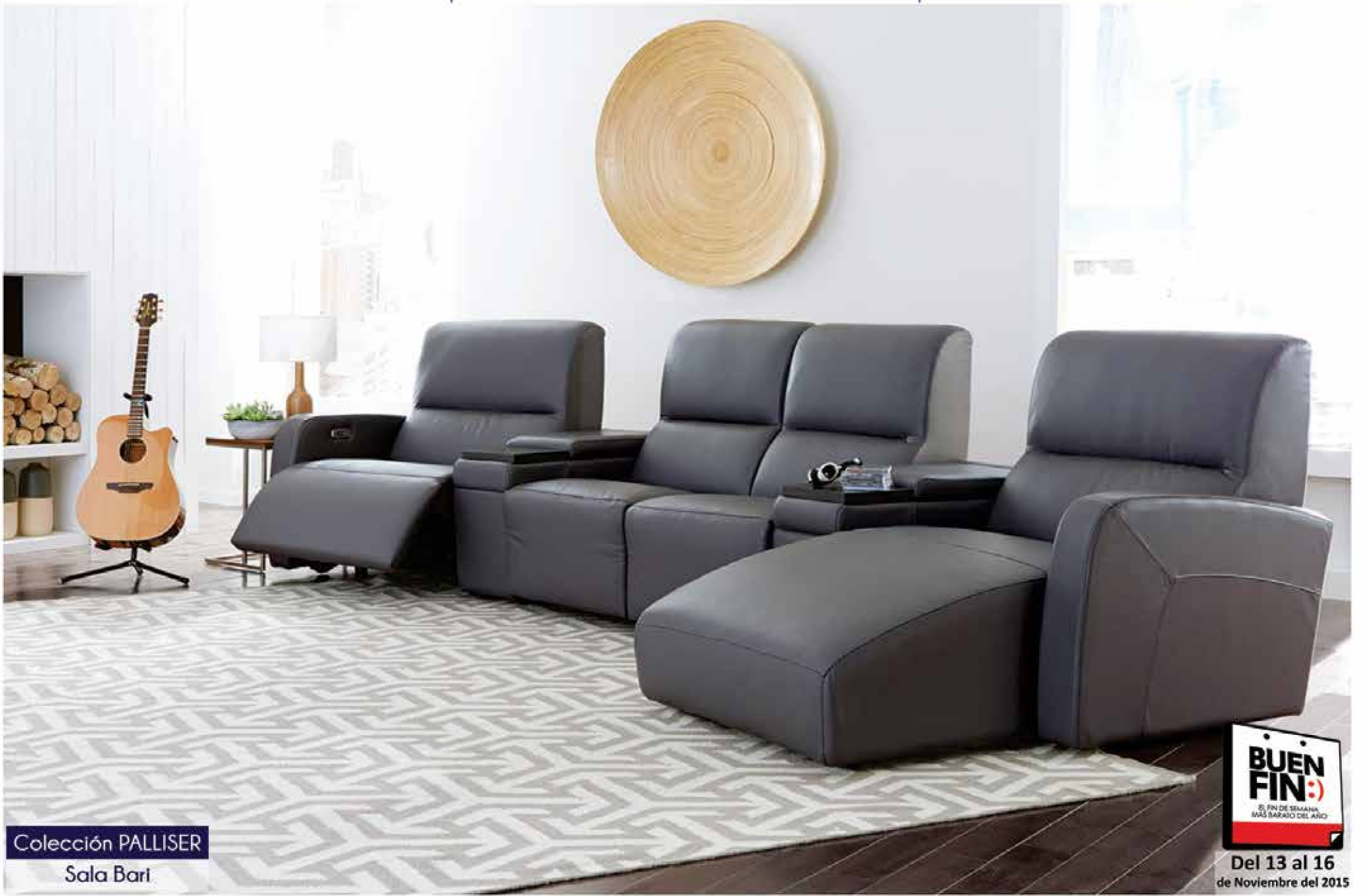
Colección PALLISER Sala Bari

BUEN FIN El fin de semana más barato del año Del 13 al 16 de Noviembre del 2015